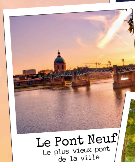
Le Pont Neuf Le plus vieux pont de la ville