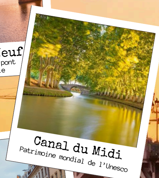
Canal du Midi Patrimoine mondial de l'Unesco