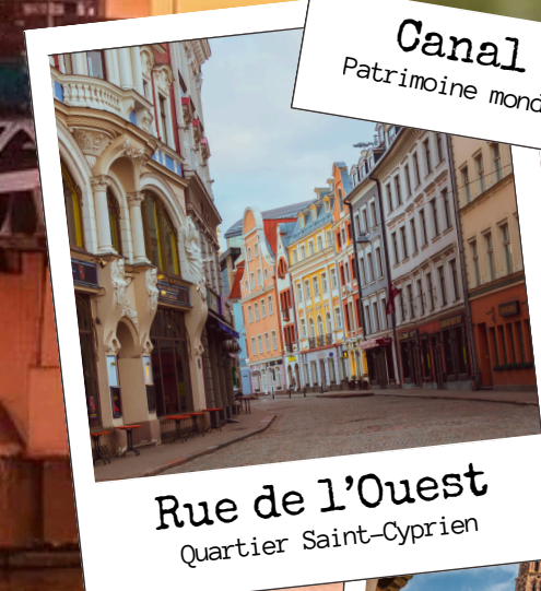
Rue de l'Ouest Quartier Saint-Cyprien