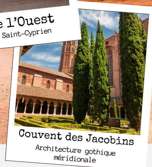
Couvent des Jacobins Architecture gothique méridionale